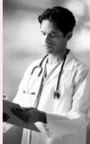
ρα στη ΜΥΛΛΕΡΟΥ; Τι θα λένε αύριο, πέρασε από τη

Άραγε τον ταλαιπωρημένο ασφαλισμένο – συνταξιούχο αλλά και συνάδελφο ποιος τον σκέφτηκε; Πως θα μετακινηθεί στα Κάτω Πατήσια, πόσες ώρες ή μέρες θα χρειαστεί για να ολοκληρώσει τις ανάγκες του, αφού οι υπηρεσίες αυτές έχουν άμεση σχέση μεταξύ άλλων υπηρεσιών που συστεγάζονται σήμε-