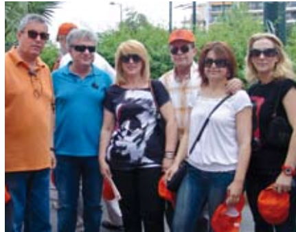
Συμμετοχή της ΕΔΟΠ στο συλλαλητήριο της ΓΣΕΕ-ΑΔΕΔΥ.

Μέσα σε ελάχιστο χρονικό διάστημα ο πληθυσμός της χώρας μας μετατράπηκε από πολίτες σε υπηκόους και μάλιστα ξένων αφεντάδων. Η λέξη « τρόικα » αντικατέστησε κάθε άλλη λέξη που αντιπροσώπευσε μέχρι