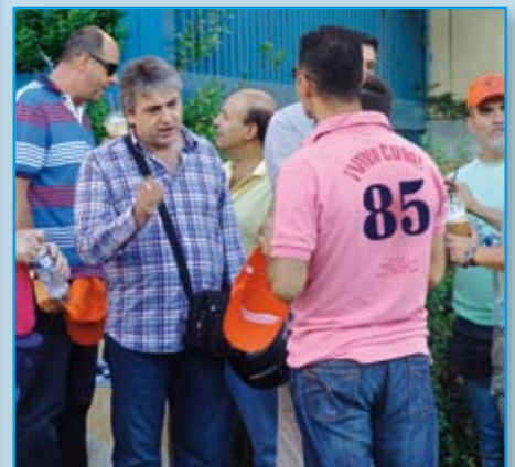
Κατάληψη στο Υπουργείο Υποδομών, Μεταφορών και Δικτύων, όπου και σε αυτή την εκδήλωση η παρουσία της ΕΔΟΠ-ΔΕΗ ήταν έντονη, όπως φαίνεται στη φωτο.

Θα πρέπει μάλιστα να τονίσουμε πως η ΔΕΗ αντιμετωπίζει ένα επιπρόσθετο πρόβλημα που έχει να κάνει με τους λεγόμενους «εποχικούς» πελάτες, ένα μεγάλο μέρος των οποίων αρνείται να πληρώσει τους λογαριασμούς του ηλεκτρικού ρεύματος. Πρόκειται για τους Οργανισμούς Εγγείων Βελτιώσεων που ελέγχουν μια σειρά από αντλιοστάσια απαραίτητα για τις αρδεύσεις και αριθμούν περί τους 290 σε όλη τη χώρα. Η πρακτική που ακολουθείται μέχρι σήμερα είναι να ζητάνε ένα διακανονισμό την άνοιξη που η ηλεκτροδότηση είναι απαραίτητη για τις αρδεύσεις, τον οποίο στη συνέχεια ποτέ δεν τηρούν, καθώς τους είναι αδιάφορο αν θα έχουν ρεύμα μετά το καλοκαίρι. Έτσι, οι οφειλές συσσωρεύονται μέχρι την επόμενη άνοιξη που με την πίεση και των τοπικών βουλευτών η ΔΕΗ προχωράει σε νέους διακανονισμούς. Αντίστοιχη είναι η κατάσταση και με περίπου 270 Δημοτικές Επιχειρήσεις Ύδρευσης και Αποχέτευσης που αρνούνται να πληρώσουν τους λογαριασμούς ρεύματος. Οι συνολικές οφειλές της ΔΕΗ από αυτές τις δύο κατηγορίες πελατών ανέρχονται σε 30 εκατομμύρια Ευρώ.